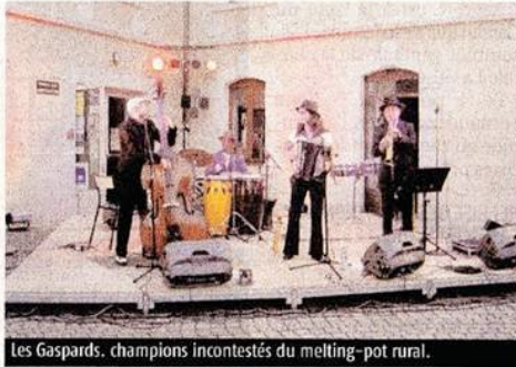
Les Gaspards, champions incontestés du melting-pot rural.