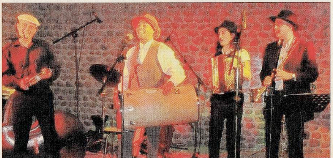
Les Gaspards sur scène.

De quoi ravir un chaleureux public sur scène et hors scène pour une belle fête en musique.