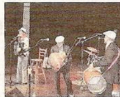
De nombreuses influences dans la musique des Gaspards.

jours attachant, le concert proposé a allié humour, autodérision et performance musicale.