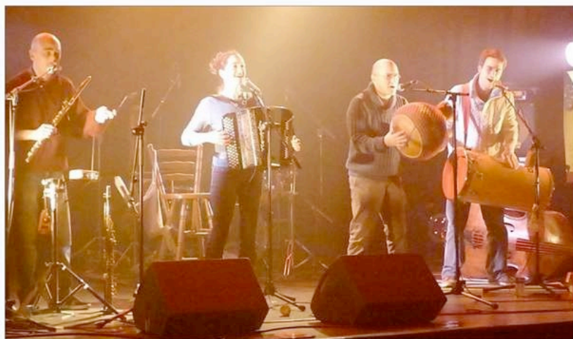
Les Gaspards étaient en résidence à la Presqu'île et ont montré leur travail au public, mercredi soir.

L e quatuor ardéchois Les Gaspards avait posé ses valises pour plusieurs jours de résidence à la Presqu'île/Smac 07, peaufinant la mise en place des lumières sur leur prestation scénique.