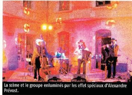
La scène et le groupe enlumines par les effet spéciaux d'Alexandre Prévost.

Durant l'ultime soirée du 6 août, les Gaspards (dernier groupe en lice) ont terminé la saison de façon spectaculaire.