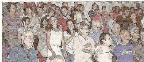
250 personnes ont apprécié le spectacle.

Little New York dans ton bled... Le titre avait de quoi interpeller. New York, lieu emblématique du brassage des cultures voilà un premier indice... Car la musique des Gaspards est issue de la rencontre d'influences intercontinentales. Amérique du Sud, Afrique, Europe de l'est et... Ardèche, leur spectacle original (à tous les sens du terme) est un mélange qui survole les océans. Jeudi soir, les 250 spectateurs de la salle du Calibert sont séduits. Décalé, éclectique, mais tou-