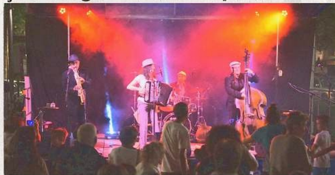
Un beau concert participatif.