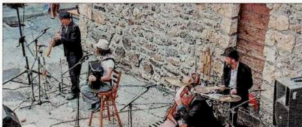
Les Gaspards ont enchanté le public avec leurs chansons décalées.

D ans le cadre du festival des Randonnées musicales du Ferrand, Les Gaspards ont enthousiasmé le public sur la placette de Clavans-le-Haut. Près de 160 personnes ont apprécié ces musiques du monde. Des chansons qui racontent des histoires parfois un peu loufoques : un