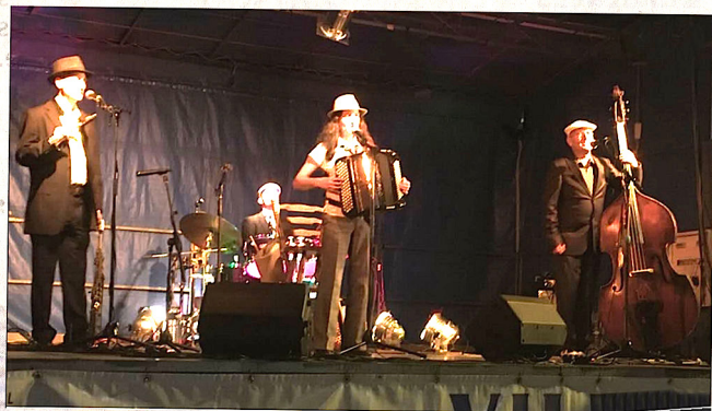
Les Gaspards affichent une belle énergie en concert.

Dernier Rendez-vous Ô quartiers sur le parking de la gare le jeudi 27 août avec le groupe Happy Day's. Un trio de musiciens confirmés dans le monde du rock'n'roll et du blues.