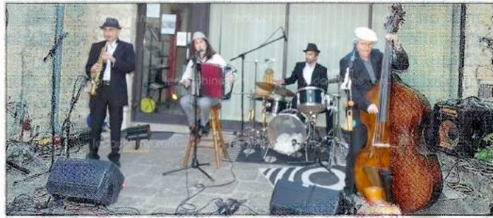
Ambiance musicale avec "Les Gaspards", groupe drômois et ardéchois.