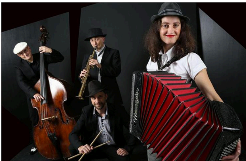
Les Gaspards présentent "Little New-York dans ton bled".

Tel 04 75 29 69 53 ou associationlepoissonvolant@gmail.com